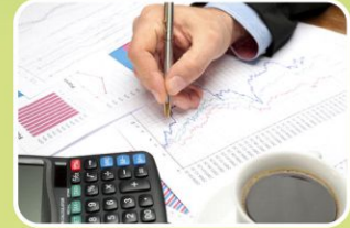
डीपीआर और एफयूपी