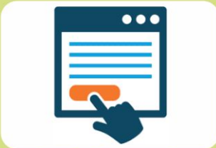
सब्सिडी के लिए आवेदन