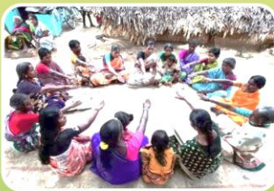
एफपीओ/एसएचजी/ को-ऑपरेटिव्स को समर्थन