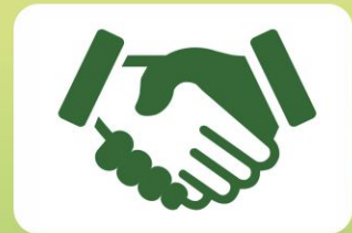
ब्रांडिंग और बिक्री