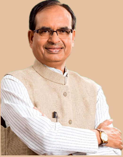
श्री शिवराज सिंह चौहान, मुख्यमंत्री